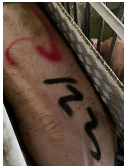
図 10. 体重測定中の写真（肥育後期）