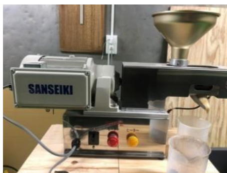
図1. 搾油機 (S100-400/サン精機)