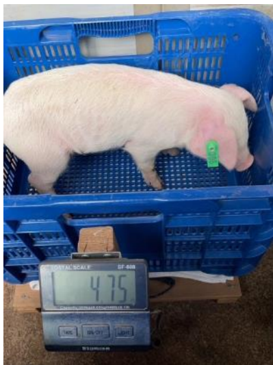
図 9. 体重測定中の写真（給与開始時）