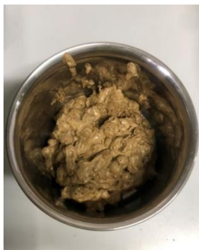
図 6. 油脂 (8 時間乾燥)