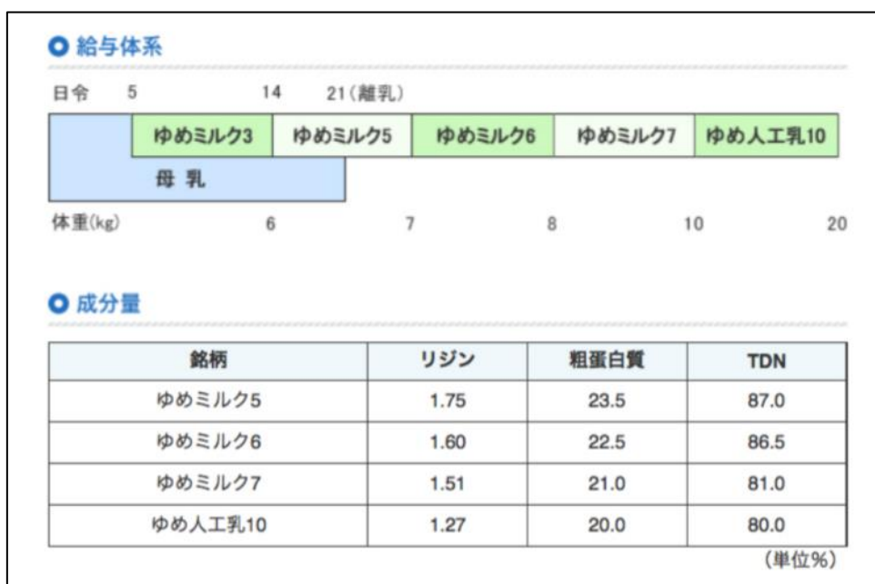
図3. ゆめミルクの給与体系と主要成分量（同ホームページより）

また、同ホームページには種類別の給与体系や主要成分量に関する情報も掲載されている。（図3）