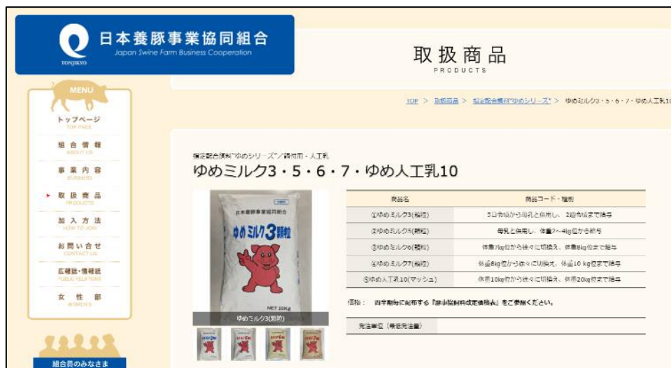
図2. ゆめミルク商品概要（日本養豚事業協同組合ホームページより）

また、同ホームページには種類別の給与体系や主要成分量に関する情報も掲載されている。（図3）